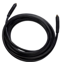
Högtrycksslangar - för 3/8" Ergo koppling

Med ErgoSystem kan man på några sekunder byta tillbehör på tvätten – helt utan verktyg – och det stora tillbehörsprogrammet gör det enkelt att anpassa tvätten till olika rengöringsuppgifter.