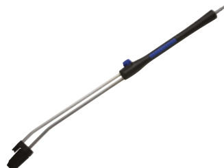
3 – PowerSpeed vario plus spolrör