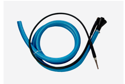
Slamsug utan rörliga delar