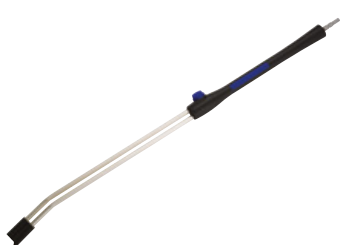
1 – Tornado plus spolrör

Hållbara, bekväma lättvikts-spolrör. Plus spolrör är tillverkade i korrosionsbeständigt rostfritt stål och med ergonomisk och optimal greppkomfort. Vi har spolrör till nästan alla rengöringsuppgifter – även till de mer speciella.