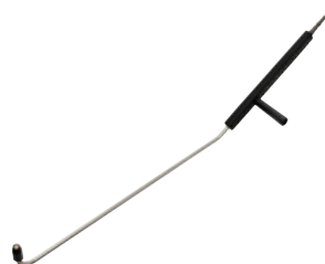
5 – Underspolrör 109 cm