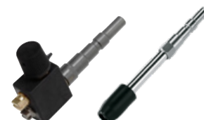
4 – Kort dubbelt spolrör och kort enkelt spolrör