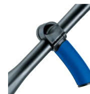
8 – Tvärgrepp till plus spolrör