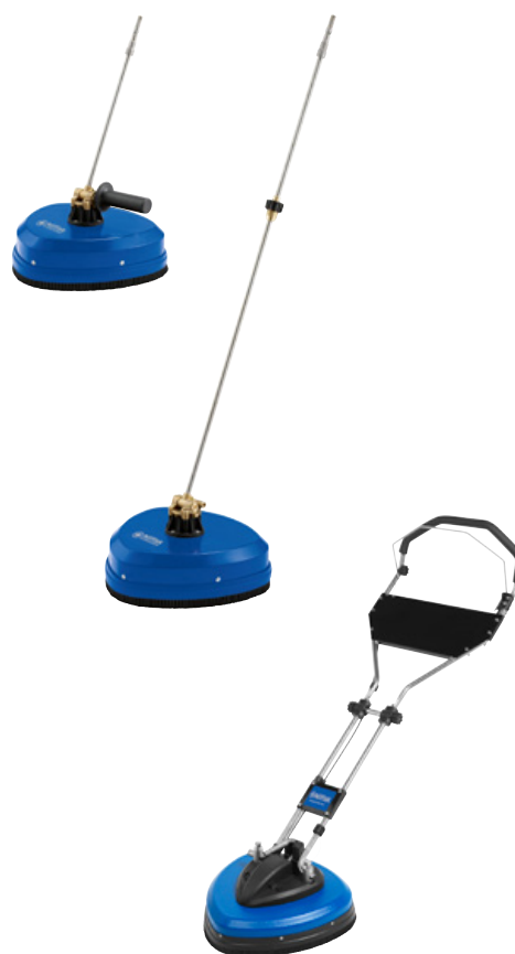
HydroScrub P300 P+H, P400