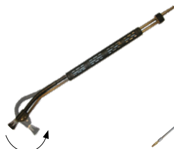
6 – Variabelt spolrör 0-120 grader