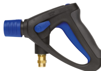
Ergo 2000 spolhandtag

Låg aktiveringskraft – lättare att aktivera spolhandtaget. Låg hållkraft – lättare att hålla pistolhandtaget aktiverat och minskar belastningen på hand och fingrar. Fantastisk VarioPress-funktion, som kan aktiveras med en hand.