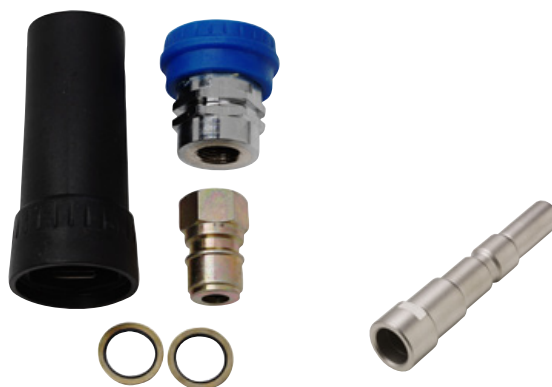
Ergo högtryckskoppling set, han- och honkoppling med slangavlastare