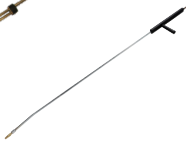
7 – Distansspolrör