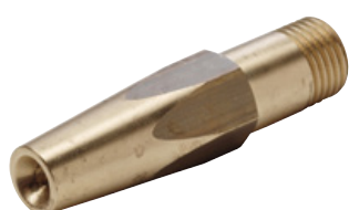
Munstycke till distansspolrör