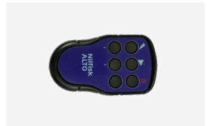
Trådlös fjärr-kontroll till motordrivna hetvattentvättar