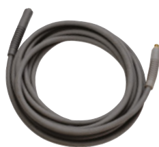
Högtrycksslangar, svärfria - för 3/8" Ergo koppling. Lämplig inom livsmedelsindustrin