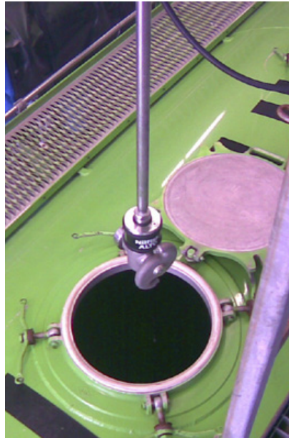
Tankrengörare i många utföranden och olika drivkällor