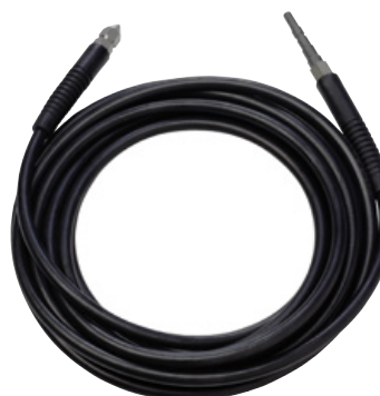
Rör- och avloppsrensare