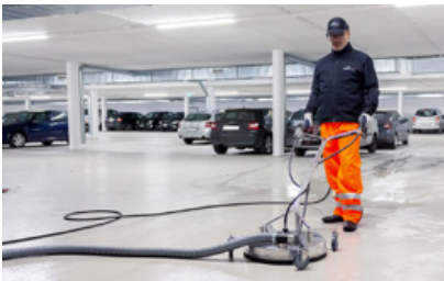
Golv och takrengörare med eller utan anslutning för våtsugare