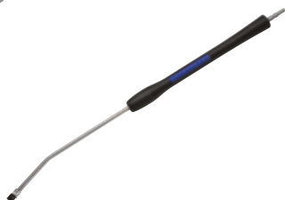
2 – Universal plus spolrör